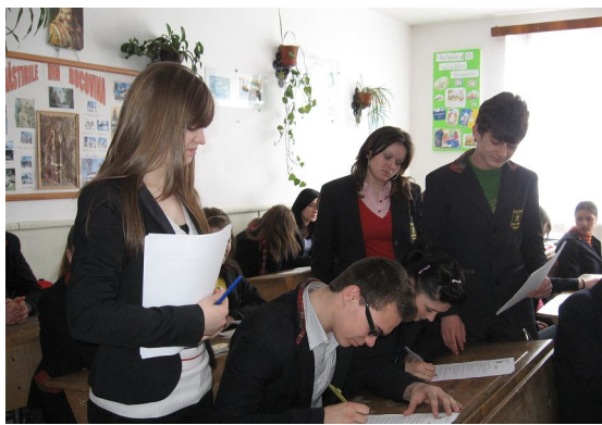
Imagini de la activitatea – Sondaj de opinie