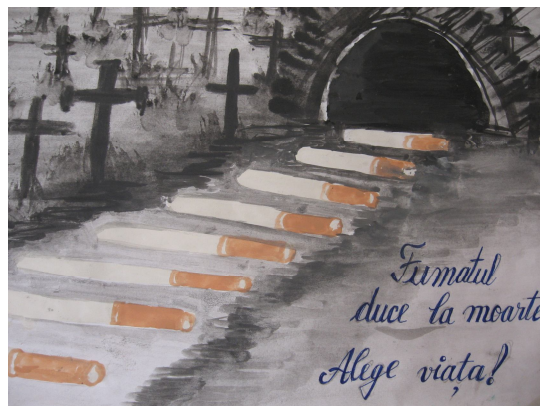
Expoziție de desene pe tema fumatului.