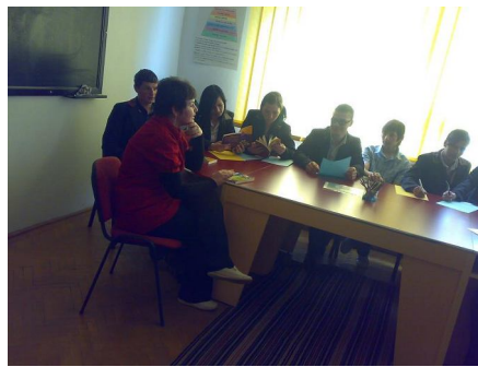
Consiliere psihologică de grup.